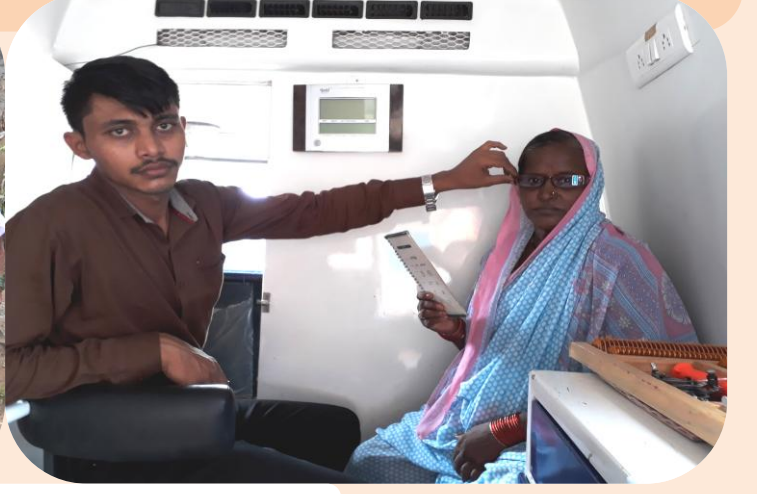
प्रौढ व्यक्तींचे नेत्र तपासणी शिबीर