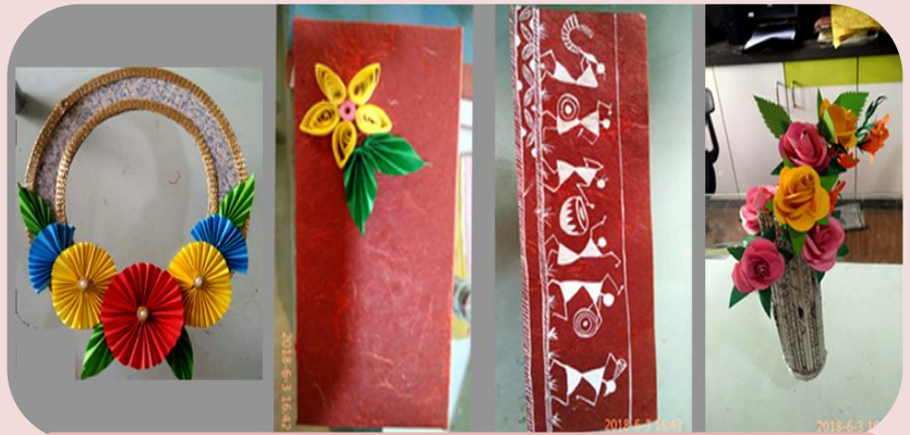
शिविरात बनविलेल्या वस्तू