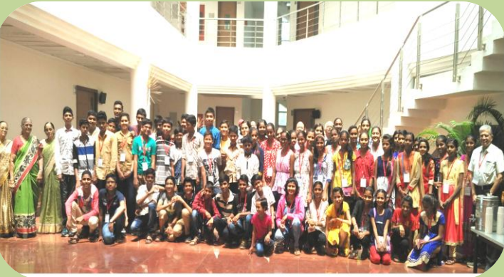
आयसर शिबिरात सहभागी झालेले विद्यार्थी

विज्ञान वाहिनी व आयसर पुणे यांच्या संयुक्त विद्यमाने ग्रामीण भागातील विद्यार्थ्यांसाठी २० मे ते २४ मे यादरम्यान आयसर येथे उन्हाळी शिबिराचे आयोजन करण्यात आले होते या सुवर्ण संधीचा विज्ञान विहारातील पाच विद्यार्थ्यांनी लाभ घेतला.