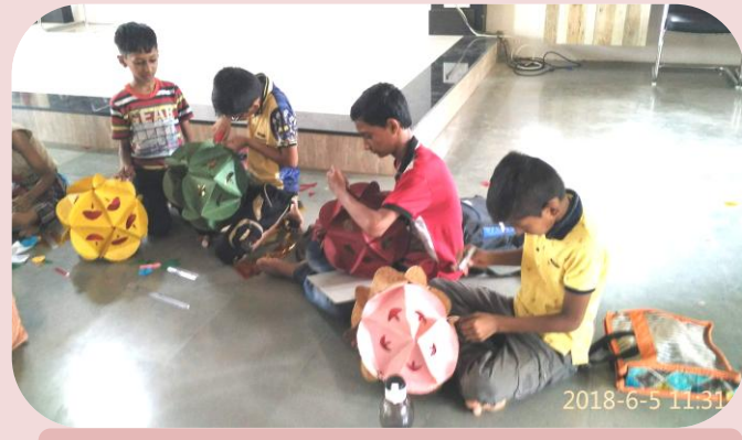
आकाश कंदील बनविताना