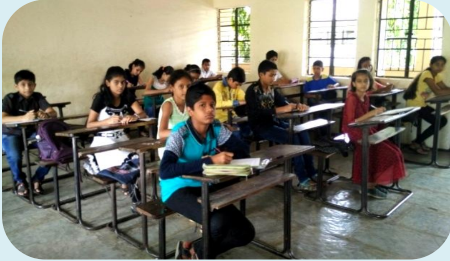
प्रवेश परीक्षा देतांना विद्यार्थी

रेऊ वाणी विज्ञान विहारात दर वर्षी विज्ञान प्रयोग वर्ग घेण्यात येतात सदर प्रयोग वर्गात हुशार व प्रयोगाची आवड असणाऱ्याच विद्यार्थ्यांची निवड करता यावी यासाठी ५० प्रश्नांची बहुपर्यायी स्वरूपात प्रवेश परीक्षा घेतली जाते. दि. २४ जून २०१८ रोजी झालेल्या प्रवेश परीक्षेस ३४४ विद्यार्थी बसले. यावेळी 'विद्यार्थी व पालकांसाठी गरज स्पर्धा परीक्षांची' याविषयी मार्गदर्शन आयोजित करण्यात आले होते.