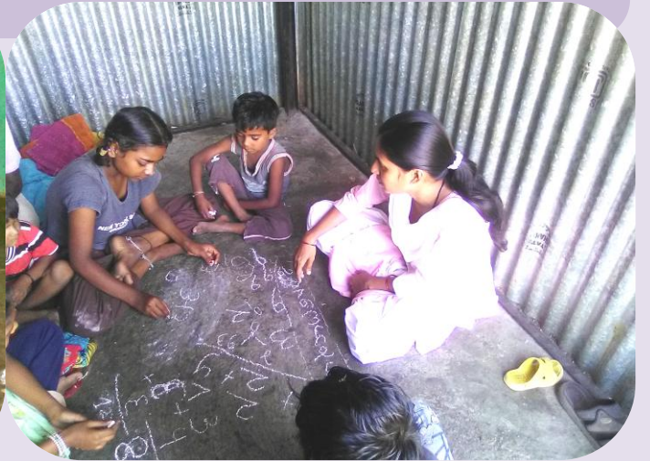
शाळाबाह्य मुलामुलींना शिकविताना-