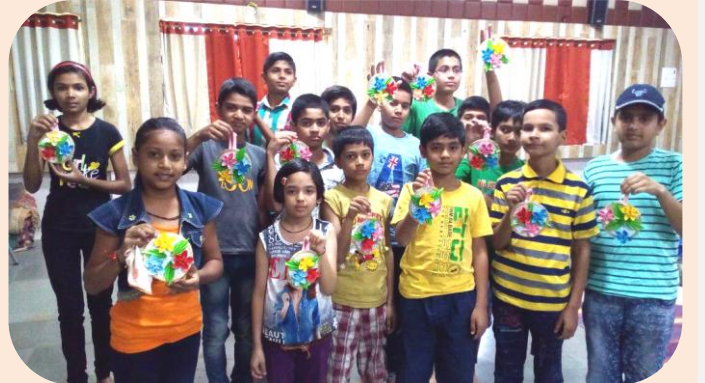
विद्यार्थ्यांनी बनविलेले वॉलहॅंगिंग