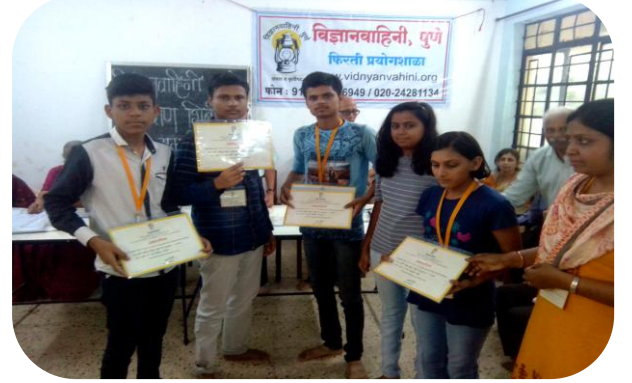
शिबिरात सहभागी झाल्याबद्दल प्रमाणपत्र

इयत्ता १०च्या विद्यार्थ्यांसाठी विज्ञान वाहिनी तर्फे पुणे येथे दि.१७ ते २१ जून पर्यंत विज्ञान शिबिराचे आयोजन करण्यात आले होते. यात विज्ञान विहाराच्या पाच विद्यार्थ्यांचा सहभाग होता.