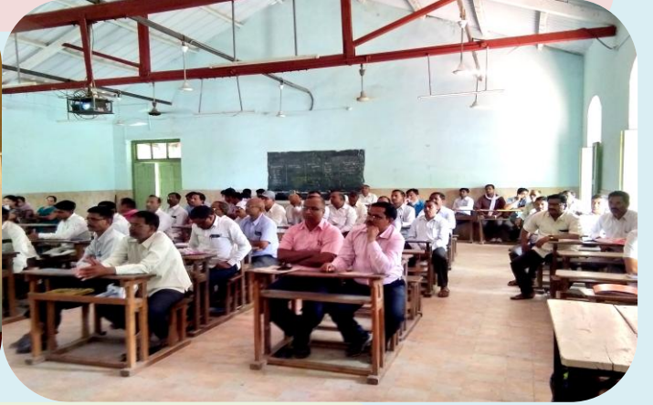
शिक्षकांना स्लाईड शो द्वारे प्रशिक्षण

शाळाबाह्य मुलांना शाळेच्या प्रवाहात आणण्यासाठी, दैनंदिन व्यवहारात त्यांची कोठेही फसवणूक होवू नये यासाठी उन्हाळ्याच्या सुट्ट्यांमध्ये या मुलांना शिकविण्याचे काम करण्यात आले. यामध्ये या मुलांना मुळाक्षरे, पाढे, बेरीज, वजाबाकी इ. शिकविण्यात आले. यामध्ये ६९ मुला मुलींनी सहभाग घेतला.