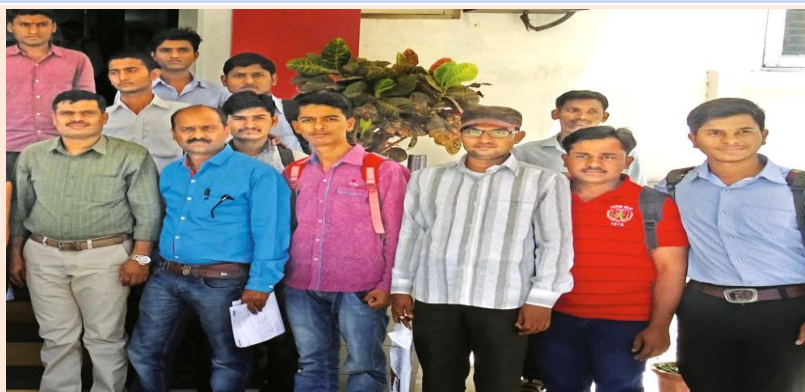
Shreyas Packaging Selected Students & Staff