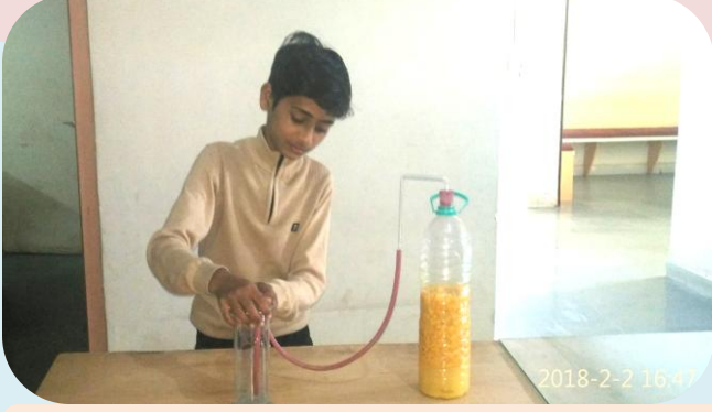
संत्र्याच्या सालीपासून निर्माण होणारा वायू शोध

दरवर्षी विज्ञान विहारातील विद्यार्थ्यांची इनोव्हेटिव्ह आयडियाज हा विषय देऊन परीक्षा घेण्यात येते .